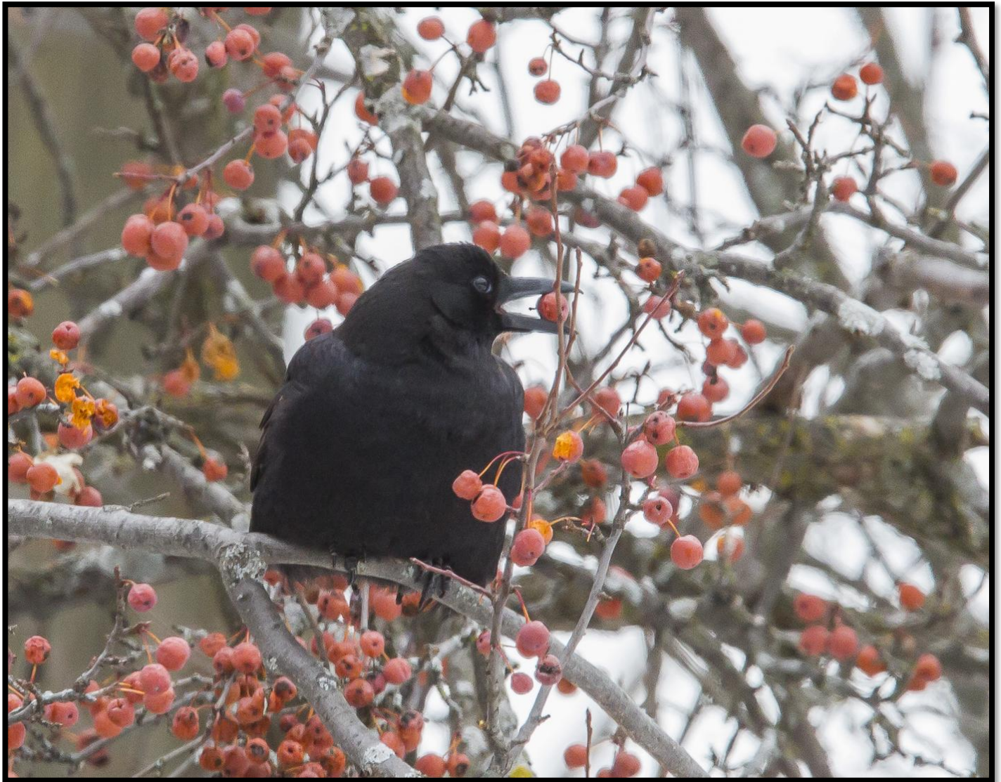
Corneille d'Amérique