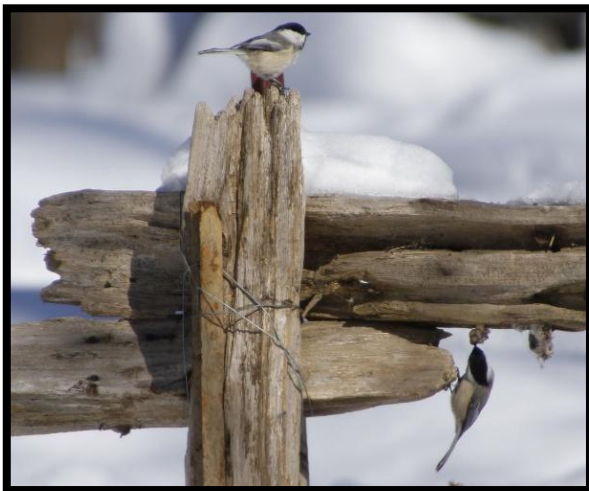
Mésange à tête noire