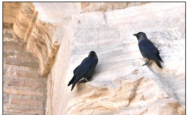
Choucas des tours

Il est pourtant joliment coloré. Généralement verdâtre sur le dos la poitrine et les ailes, il exhibe un bec rouge vif, un sourcil noir près de l'œil, un collier et une bavette noire chez les mâles. Ajoutons à cela une longue queue pointue verte tirant parfois sur le bleu-vert. Une prime-coche pour moi. Celui à gauche qui tient cette pose narquoise était momentanément perché au fronton d'une église près du forum romain.