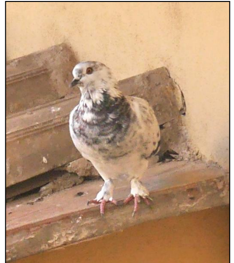
Pigeon biset (à guêtres)

Il y a aussi son cousin le Pigeon ramier, un peu plus gros, que j'ai vu à la gare de Pompéi. Heureusement qu'il n'y avait pas qu'eux!