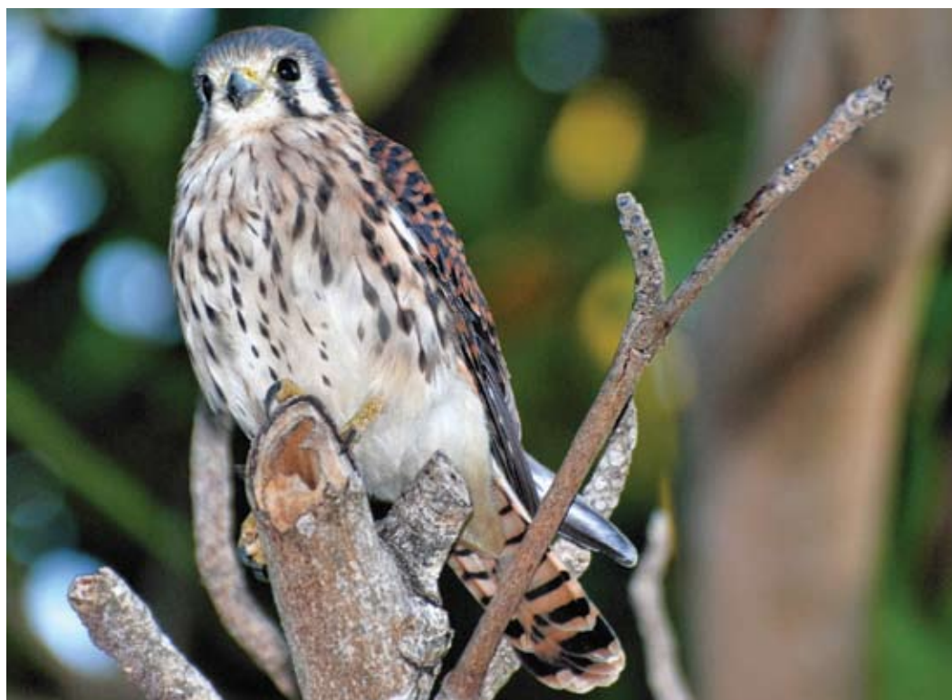
Crécerelle d'Amérique