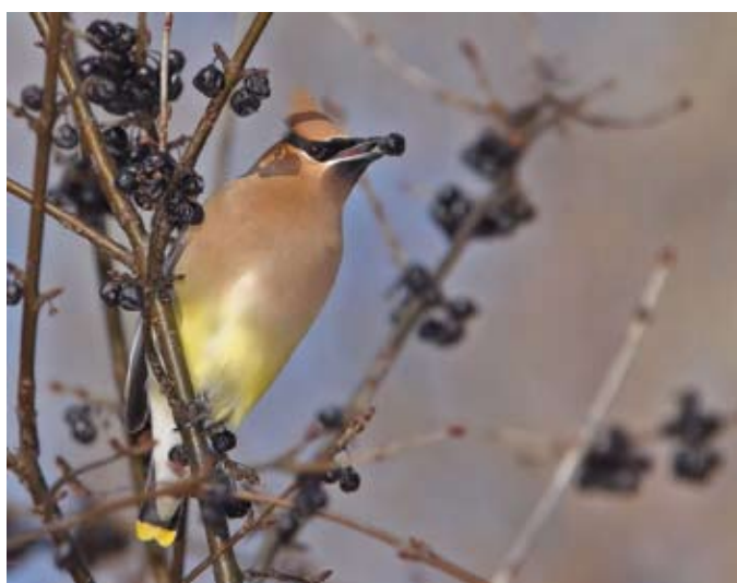
Jaseur d'Amérique