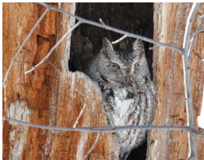
Petit-duc maculé