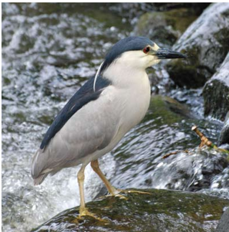
Bihoreau gris

PAR ANTOINE BÉCOTTE, YVON BELLEMARE ET DANIEL MURPHY