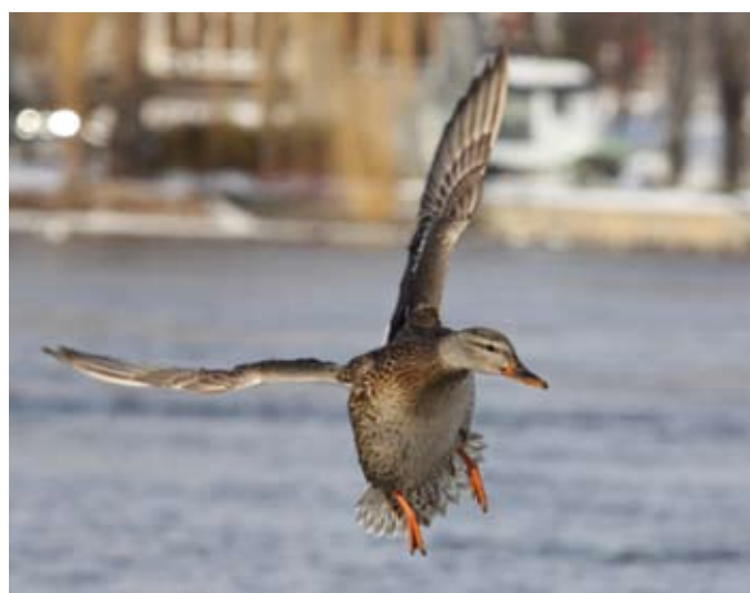
Canard colvert