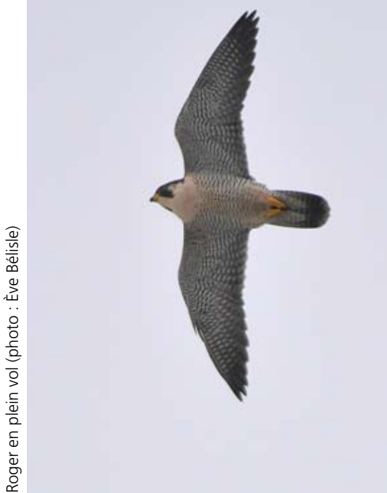
Roger en plein vol