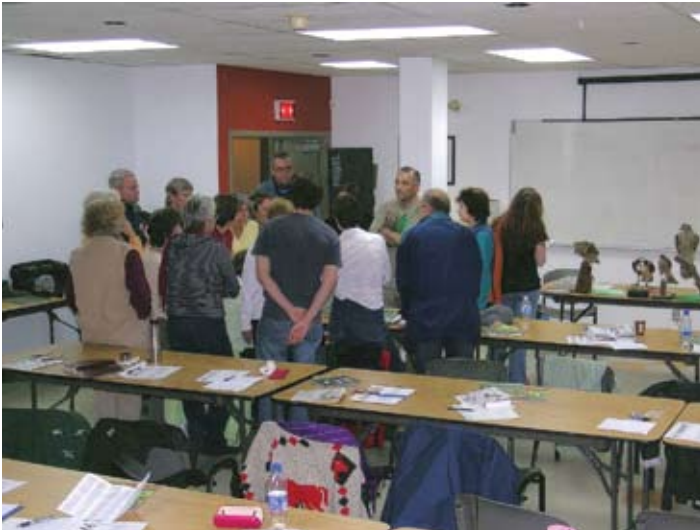
Les ateliers de formation sont une des activités offertes par le Conseil qui sont très appréciées des membres. Ici, un atelier sur les rapaces