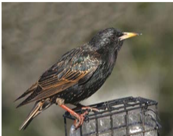
Étourneau sansonnet